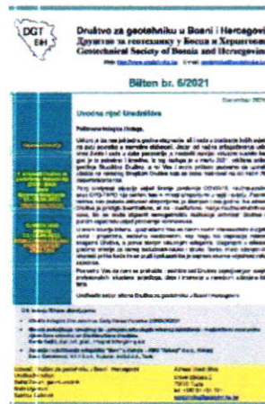
Slika 2 - 6. izdanje Biltena Društva za geotehniku u Bosni i Hercegovini. Bilten je dostupan na internet stranici Društva za geotehniku u Bosni i Hercegovini: http://www.geotecnika.ba