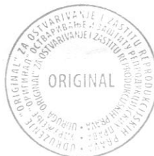
Goran Simić, Predsjednik Udruženja