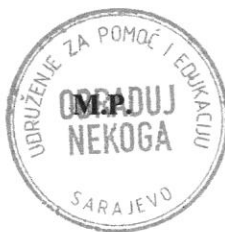
AIDA SADIKOVIĆ MEHONIĆ Odgovorno lice

Izjavljujemo da su svi finansijski izvještaji navedenog pravnog lica i za navedeni obračunski period u potpunosti urađeni u skladu sa Zakonom o računovodstvu i primjenom kompletnih MSFI za MSP (mala i srednja pravna lica) - Međunarodnih računovodstvenih standarda i Međunarodnih standarda finansijskog izvještavanja.