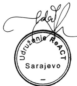
Ida Avdibegović Odgovorno lice